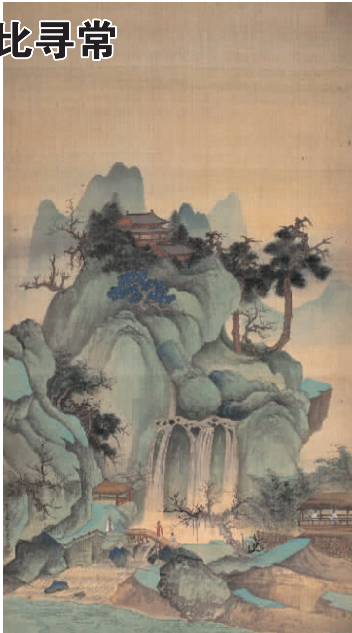
张大千 宋人山寺图 北京匡时成交价 1433.6 万元

董国强又指出,整个行业还处于投资市场,参与拍卖的买家主要靠利益驱动,还未靠文化驱动,整个拍卖市场好比股市,追涨杀跌,因此,资金并不是最重要,信才最重要。